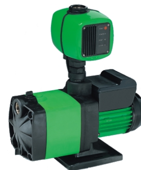
Pumpe Kreisel 4/1000